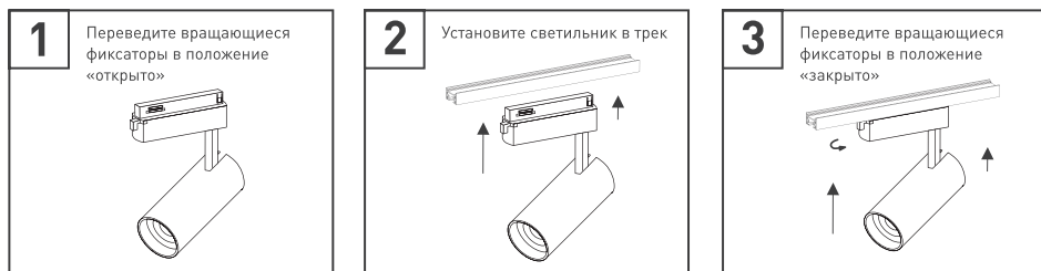
Рис. 3. Установка и подключение светильника

ВНИМАНИЕ! Приведенная в этом разделе информация не является исчерпывающей и носит ознакомительный характер. Информация о полном ассортименте комплектующих для сборки трековых систем приведена в каталогах и на сайте arlight.ru . При подборе оборудования для трековой системы обращайте внимание на сторону установки коннекторов. Левый коннектор обозначен буквой L, правый — R.